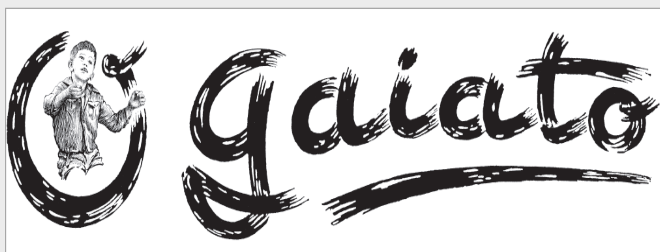
Créditos da imagem: Logotipo do jornal quinzenal “O Gaiato”, fundado por Padre Américo a 5 de março de 1944 e atualmente ainda em circulação

(Mais informações e resultados já disponíveis em: http://portal.cehr.ft.lisboa.ucp.pt/PadreAmerico/index.html )